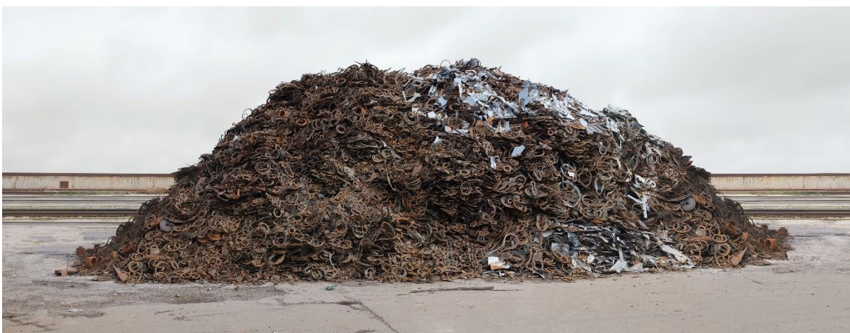
Gabriele Engelhardt, Metallringeburg Krems , 2023