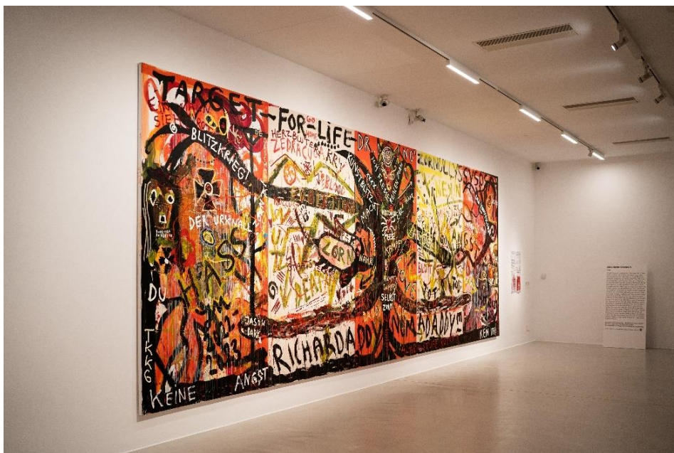
Jonathan Meese, „GESAMTKUNSTWERK ZORN“ (IREIFEZEUGNIS „BABYZORNUSSUS“), 2023