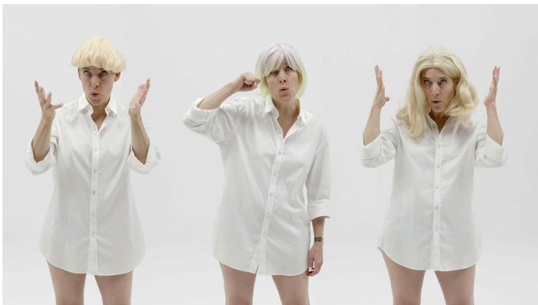
Candice Breitz, Whiteface (filmstill), 2022, Commissioned by the Museum Folkwang with support from the Kunsthalle Baden-Baden

In „Whiteface“ macht sich die Künstlerin diese Archivistimmen zu Eigen und stellt, mit wechselnden Perücken ausgestattet, die Bedingungen des Weißseins in den Mittelpunkt. Der Film ist ein Porträt der in Panik geratenen Weißen und persifliert diese absurde Angst. Die bewusst theatralische Darbietung der Künstlerin lenkt die Aufmerksamkeit auf die Konstruiertheit des Weißseins und anderer rassifizierter Kategorien.