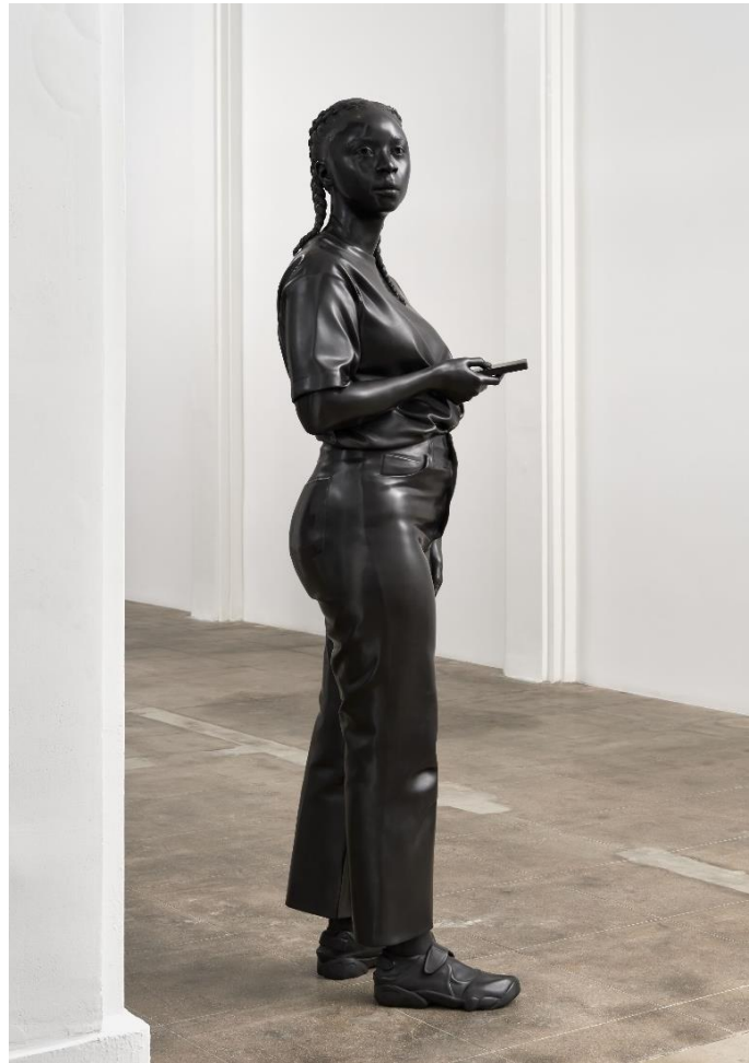
Thomas J Price, A Place Beyond , 2023 © Thomas J Price, Courtesy the artist and Hauser & Wirth, Photo: Keith Lubow

PRESSEBILDER: https://celum.noeku.at/pinaccess/showpin.do?pinCode=KunsthalleKrems2024