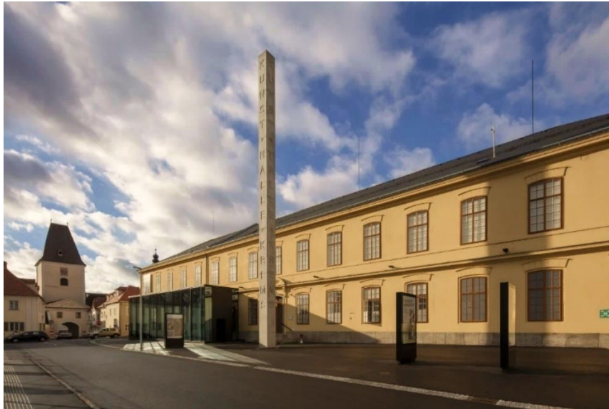
Kunsthalle Krems

Die Kunsthalle Krems ist das niederösterreichische Ausstellungshaus für zeitgenössische, internationale Kunst. Die Genres reichen von Malerei über Fotografie und Skulptur bis hin zu Medienkunst. In ihrer Programmatik gibt die Kunsthalle Krems der kritischen Auseinandersetzung mit gesellschaftsrelevanten Themen Raum. Sie lebt Heterogenität, Diversität, Solidarität, Toleranz, Meinungsfreiheit und Weltoffenheit und wird ihrem gesellschaftlichen, demokratie- und bildungspolitischen Anspruch mit ihren Ausstellungen und Veranstaltungen gerecht.