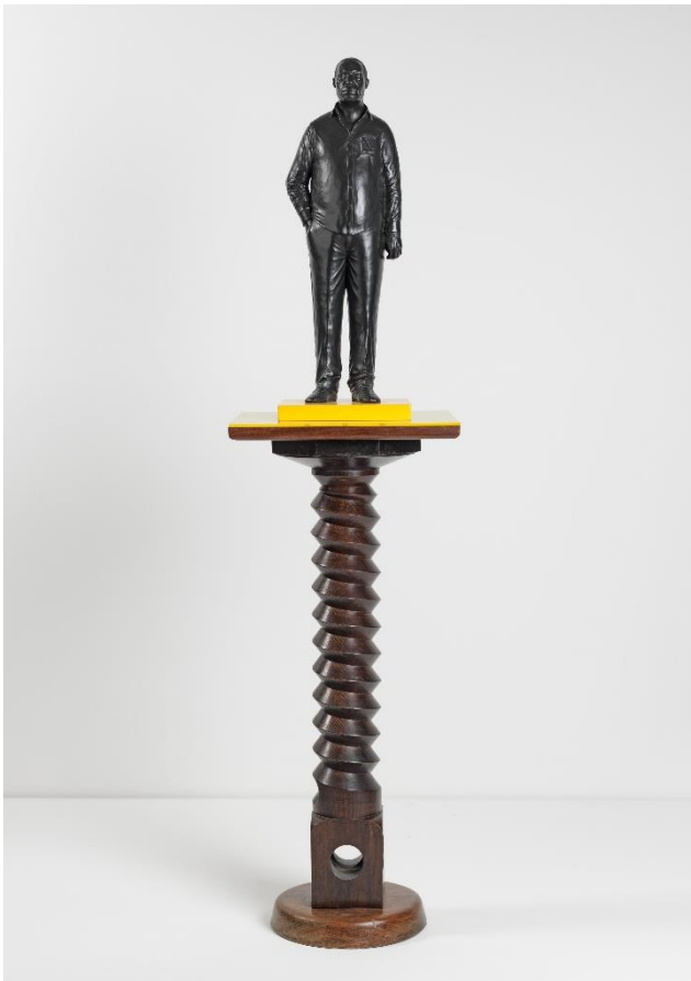
Thomas J Price, Man on a Horse (Kings Avenue) , 2011 © Thomas J Price, Courtesy the artist and Hauser & Wirth, Photo: Ken Adlard